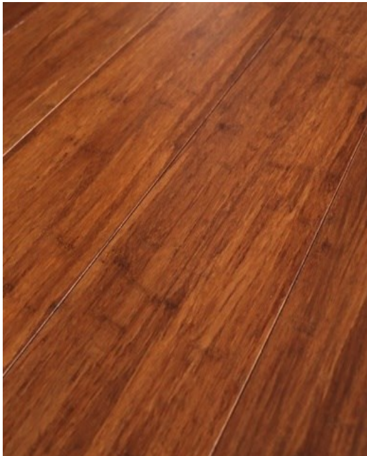
BAMBOO STRANDWOVEN HONEY 1850 X 130 X 12 MM