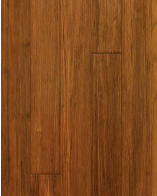
BAMBOO STRANDWOVEN 1850 X 130 X 12/14 MM