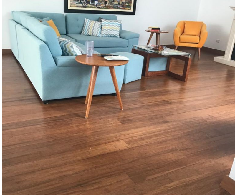
BAMBOO STRANDWOVEN 1850 X 130 X 12/14 MM